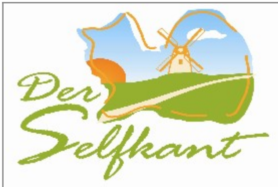
Neue Namensgebung und neues Regionslogo