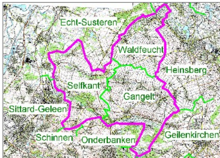
Übersichtskarte der ILEK-Region

Die Region „Der Selfkant“ stellt eine wirtschaftlich, touristisch, sozial und kulturell homogene und arbeitsfähige Einheit dar. Verbunden mit einer traditionell guten Zusammenarbeit auf Verwaltungsebene der Gemeinden bildet dieses den Grund für die Abgrenzung des Gebiets.