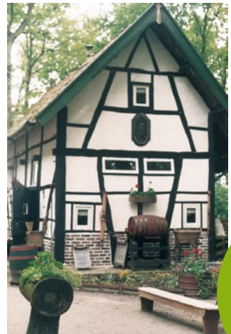
Freilichtmuseum „Nonke Buujske“

Am Rand der Schinvelder Wälder, liegt abseits vom Trubel des Alltags, das Freilichtmuseum „Nonke Buujske“. Es ist ein historisches Kleinod und einzigartig für die Niederlande. Es ist ein Standort für südlimburgische Fachwerkhäuser aus dem Beginn des vorigen Jahrhunderts. Mittelpunkt ist das Fachwerkbauernhaus mit Backhaus und verschiedenen Werkstätten wie Schusterei, Zimmerei, Webhaus und Holzschuhmacherei. Sämtliche Gebäude sind mit authentischen Möbeln und Gebrauchsgegenständen ausgestattet.