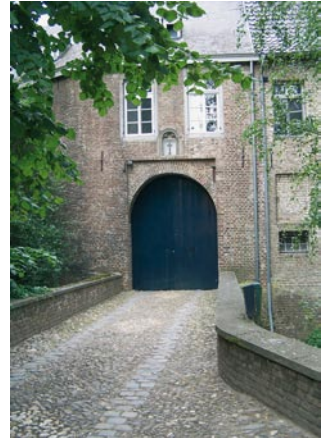
Haus Millen (NL)