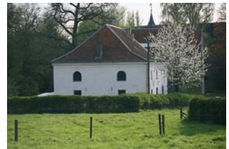
Millener Mühle (D)