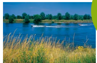
Maas bei Maaseik (B)