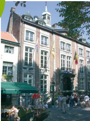
Altes Rathaus in Maaseik (B)

Auf dem Weg vom niederländischen KP 16 (Nieuwstadt) zum KP 11 (Dieteren) lohnt sich ein Abstecher nach Susteren, wo übrigens die Niederlande am schmalsten und der Landstreifen zwischen Deutschland und Belgien, dem so genannten Flaschenhals, nur ca. 5 km breit ist. Besonders sehenswert ist die St. Amelbergakirche, deren Ursprünge auf ein Kloster aus dem 7. und 8. Jh. zurückgehen. Nach ihrer Verwüstung durch die Normannen im Jahre 882 wurde sie durch König Swentibold von Lothringen wieder aufgebaut. Erste Äbtissin wird Amelberga und König Swentibold wird in der ehemaligen Abteikirche nach der Schlacht bei Susteren begraben. Im Laufe des 11. Jh. wird das alte Kloster in ein adliges Damenstift umgewandelt. Wahrscheinlich wurde zur gleichen Zeit auf den Grundfesten der alten Kirche eine völlig neue Kirche erbaut.