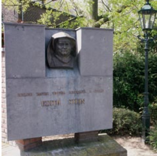
Edith-Stein-Rundgang Echt (NL)

An der Teilstrecke vom Knotenpunkt 39 (Maasbracht) nach 04 liegt der Ort Echt. Hier lebte im Karmel in der Bovensteestraat vom 31.12.1938 bis 2.8.1942 Edith Stein. Sie wurde 12.10.1891 in Breslau als 11. Kind frommer Juden geboren. 1913 kam sie nach Göttingen, um dort beim Philosophen Prof. Edmund Husserl zu studieren. Ihre Studien schloss sie in Freiburg mit „summa cum lauda“ ab.